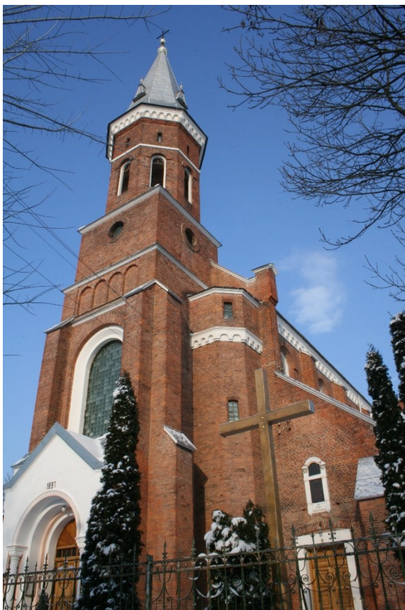
Kościół parafialny pw. św. Ignacego Loyoli w Kołomyji, dawniej oo. Jezuitów – piąta świątynia kultu maryjnego MB Kołomyjskiej, fot. Andrzej Łopaczak 2006