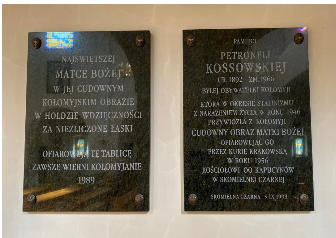
Tablice pamiątkowe związane z Kołomyją w kościele oo. Kapucynów w Skomielnej Czarnej

Świadectwem otrzymanych łask jest tablica dziękczynna umieszczona w kościele w Skomielnej Czarnej i ufundowana przez kołomyjan 1989 o treści: