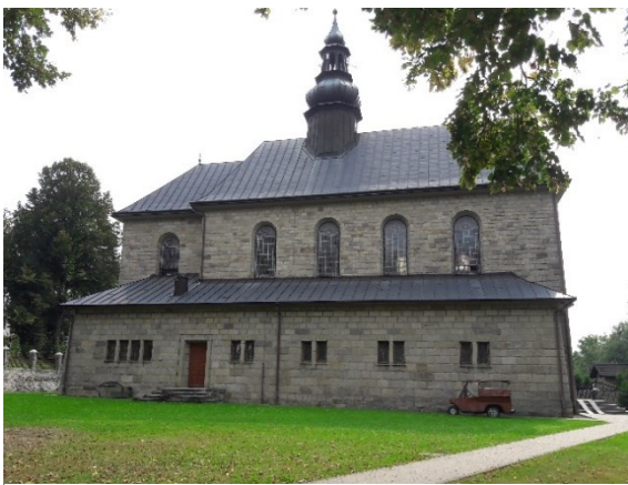
Kościół oo. Kapucynów pw. Nawiedzenia NMP w Skomielnej Czarnej – czwarta świątynia kultu maryjnego MB Kołomyjskiej

233 srebrnych, 109 sznurów koraliki, 11 z imitacji pereł, 20 z imitacji granatów, pasek z muszelek i 56 innych 8 . Przez okres obu okupacji sowieckiej i niemieckiej świątynia była czynna. Gdy większość Polaków opuściła rodzinne miasto została zamknięta w 1946, barbarzyńsko przebudowana i zamieniona na dom handlowy z artykułami dla dzieci. Obecnie służy cerkwi greckokatolickiej.