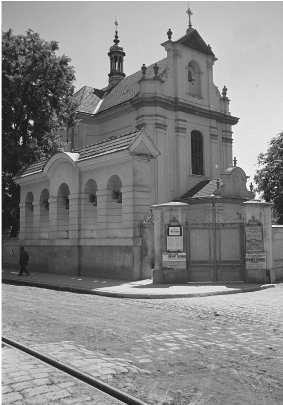
Kościół parafialny pw. Wniebowzięcia NMP w Kołomyi – trzecia świątynia kultu maryjnego MB Kołomyjskiej, fot. NN przed 1939

srebrna sukienka. Korona Madonny z berłem także były pozłacane, natomiast korona Dzieciątka i berło – srebrne. Obie korony wysadzone były diamentami, perłami i rubinami. Obraz zdobiły liczne sznury pereł (12), koraliki (22) i srebrnych paciorków (21). Oprócz przedmiotów liturgicznych samych srebrnych wotów było 114, w tym 19 pozłacanych i ze złota. Kościół posiadał siedem ołtarzy, dwa nagrobne pomniki rycerzy wojsk koronnych, a w zakrystii przechowywano 42 ornaty 6 . Tę bogatą świątynię z klasztorem wspierała fundacjami i darami pokucka szlachta, co świadczy o wyjątkowym miejscu sakralnym, skupiającym pielgrzymów wszystkich stanów z całego Pokucia.