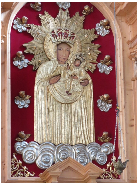
Kopia obrazu Matki Boskiej Kołomyjskiej w aranżacji sprzed 1939 w kościele pw. św. Ignacego Loyoli w Kołomyi, fot. Maria Ohanowicz 2019

Kołomyja nad Prutem od średniowiecza uważana była za stolicę Pokucia, krainy historycznej oddzielonej od północy szerokim korytem Dniestru, od zachodu puszcza bukową Czarnego Lasu, położoną między Bystrzycą Sołotwińską a Oporem, i wysokim pasmem Karpat Wschodnich, a od wschodu nurtem Czeremoszu – co stanowiło niedostępny kąt najdalej wysuniętej na południowy-wschód części Rzeczypospolitej, graniczącej z Czechosłowacją i Rumunią. Przed 1939 była wielokulturowym miastem powiatowym, liczącym około 44 tys. mieszkańców, należącym do województwa stanisławowskiego, zamieszkałym przez Polaków, Ormian, Żydów, Rusinów-Ukraińców, Niemców, Czechów, Węgrów, a nawet Francuzów i Anglików. Na przestrzeni dziejów była pod wpływem oddziaływania wielu kultur i państw. W pierwszych wiekach był to Rzym. Stąd być może pochodzi nazwa Colonia. W epoce kształtowania się państw słowiańskich w IX-X w. – zachodniosłowiańskie plemię polskotwórcze Lędzian. Od 981 gród był już w Rusi Kijowskiej, a po jej podziale w Księstwie Halicko-Włodzimierskim. W 1340 zapanowało Królestwo Polskie i okres I Rzeczypospolitej. W 1772 państwa ościenne rozebrały Rzeczpospolitą Obojga Narodów, wówczas Pokucie z Kołomyją stało się częścią Austrii Habsburgów. Po I wojnie – Zachodnioukraińskiej Republiki Ludowej, od 1919 – II Rzeczypospolitej, po układzie jałtańskim w 1945 – Związku Sowieckiego, a od 1991 jest w Ukrainie.